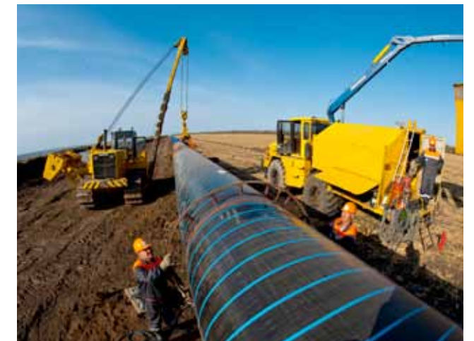
Строительство газопровода «Южный поток» (Ростовская обл.)

Обладая мощным, модернизированным парком строительной и специальной техники, компания гарантируем заказчикам мобильность и высокую оперативность всего комплекса выполняемых работ.