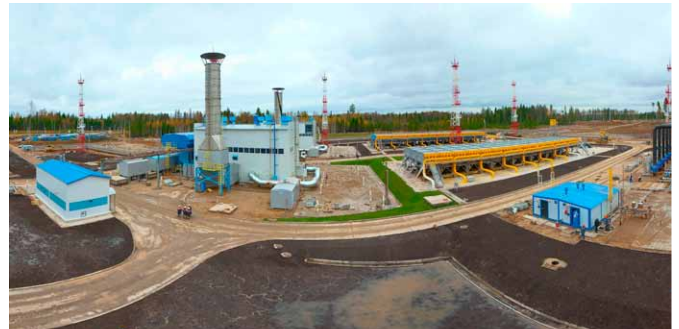
Строительство 2-й очереди КС «Грязовецкая»

В настоящее время компания ОАО «Краснодаргазстрой» обеспечивает реализацию сразу нескольких масштабных проектов нефтегазовой промышленности Российской Федерации: