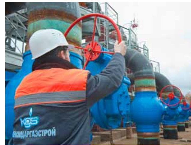
Наладка оборудования КС