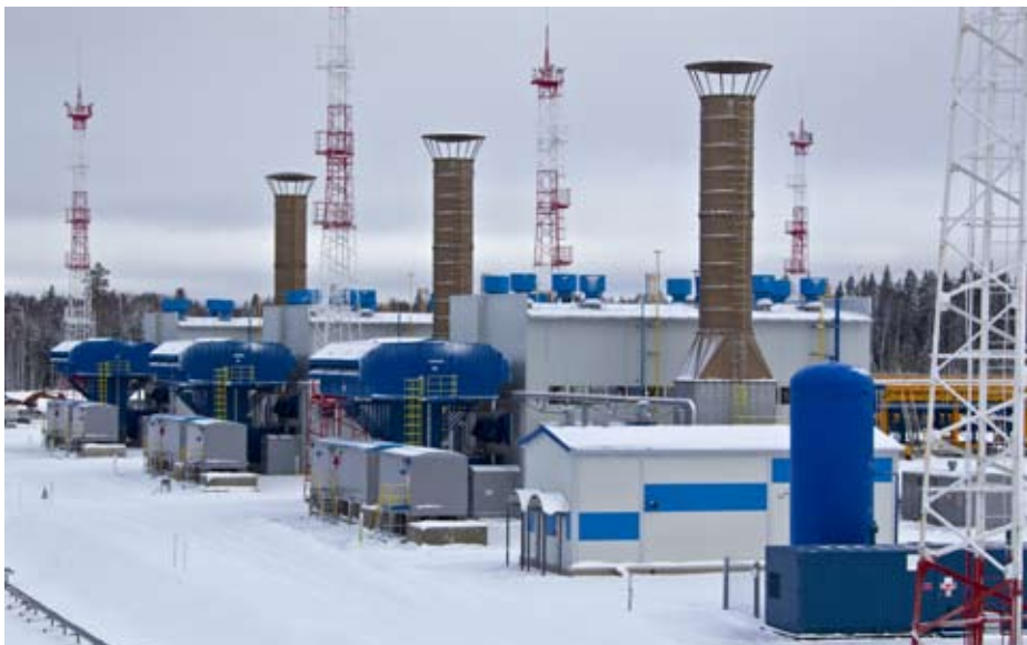
Компрессорный цех. КС «Грязовецкая», I очередь

Под эгидой Группы компаний СГМ специалисты краснодарского предприятия сегодня заняты в осуществлении ряда масштабных газостроительных проектов, таких как возведение КС «Новоюбилейная» в Волгоградской области, КС «Грязовецкая» (вторая очередь)